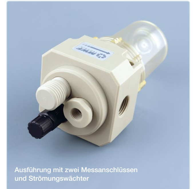
Ausführung mit zwei Messanschlüssen und Strömungswächter