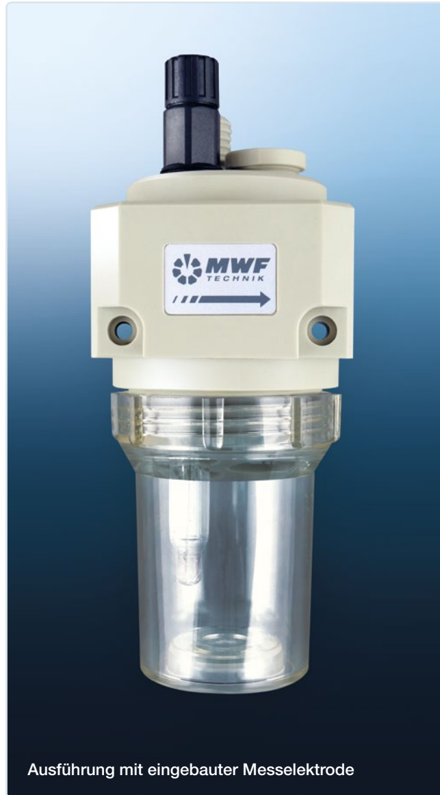
Ausführung mit eingebauter Messelektrode