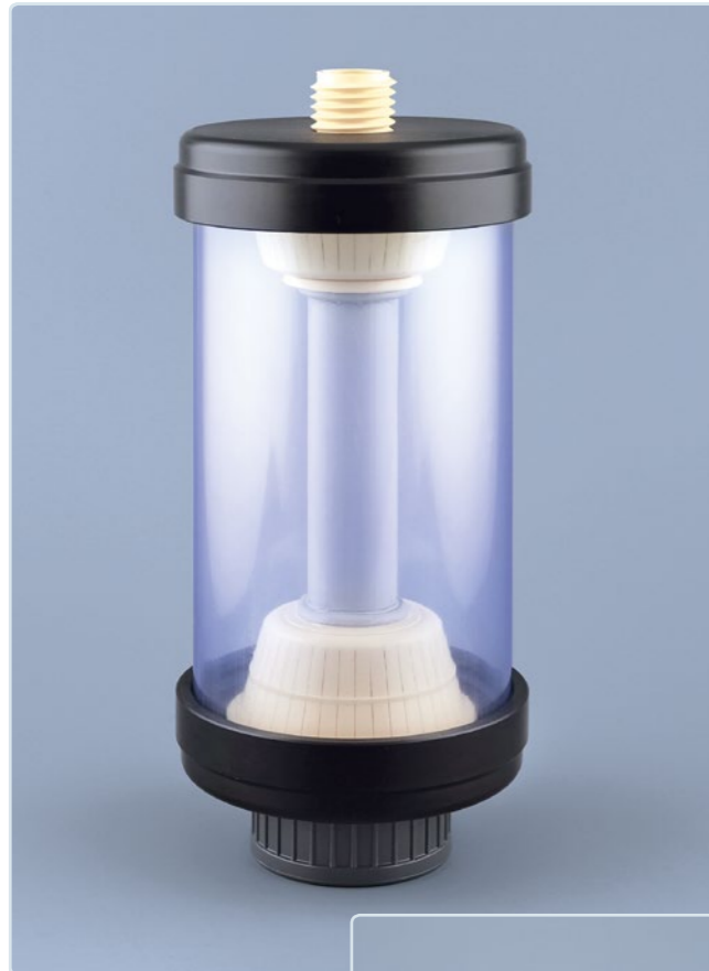
TYP SDA 90