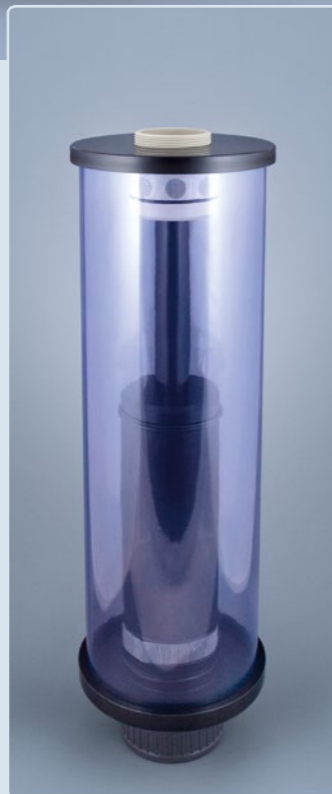
TYP SDA 160 CO 2