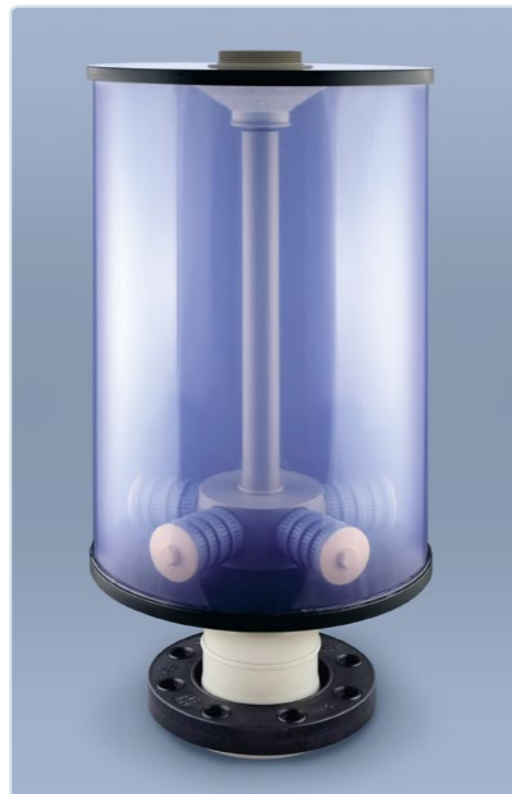
TYP SDA 315