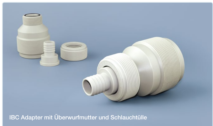
IBC Adapter mit Überwurfmutter und Schlauchtülle

Alle Preise pro Stück, ab Werk, zzgl. MwSt.